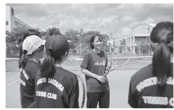
「しっかりした指導で技術を高めてくれる先生です」と部員は声を揃えます。

中1は総合的な学習の時間で稲作体験があります。5月末に田植えをしたのですが、先生がとても楽しそうで、みんなの雰囲気が明るくなりました。いつも優しく、生徒思いの先生です。